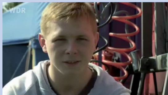
Die Gesprächspartner sind in Interviews oft in der Naheinstellung zu sehen.

Wenn das Interview gefilmt wird, müsst ihr zuerst die Kamera aufbauen und den Gesprächspartner so hinsetzen, dass er gut im Bild zu sehen ist. Erst wenn ihr mit dem Bild zufrieden seid, fangt an, zu filmen. Das kann ein bißchen dauern. Der Gesprächspartner sollte also vorher wissen, dass er sich für ein gefilmtes Interview etwas mehr Zeit nimmt als für ein Interview mit der Schülerzeitung.