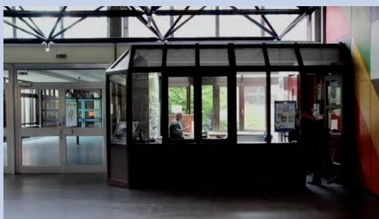
Ein Hausmeister kann zum Beispiel viel über den Alltag in der Schule berichten.

Als erstes überlegt der Filmemacher sich genau, wen er interviewen und was er von