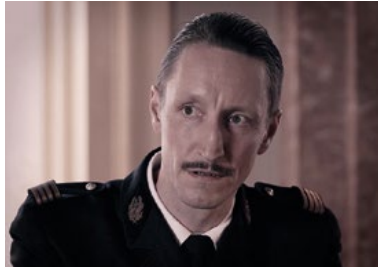
Staatsanwalt/Staatsanwältin als Vertreter*in der Anklage