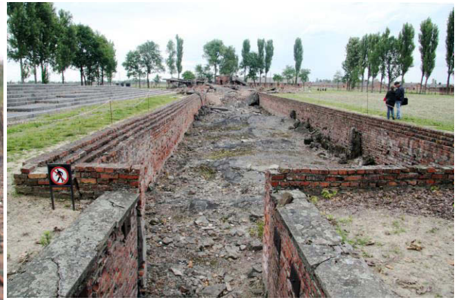
Überreste des ehemaligen Entkleideraums, der in die Gaskammer Nr. 2 in Birkenau führte.