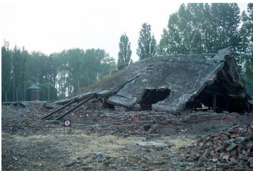
Überreste des ehemaligen Krematoriums und der ehemaligen Gaskammer Nr. 2 in Birkenau