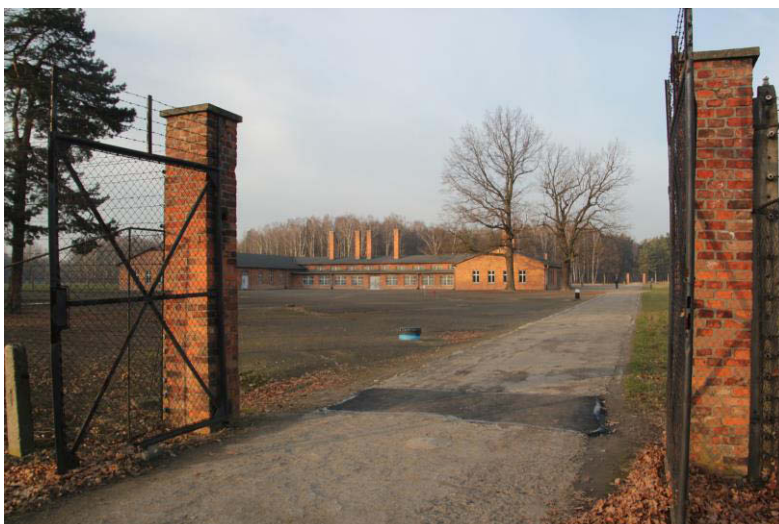
Das sogenannte Sauna-Gebäude in Birkenau