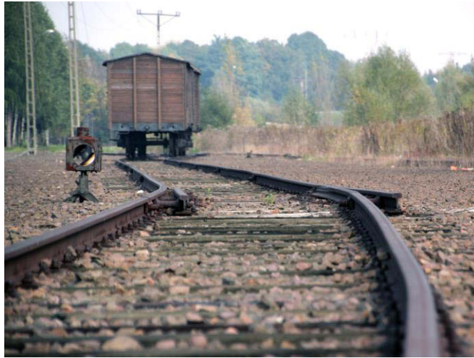
Die sogenannte Judenrampe