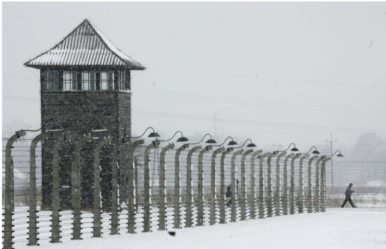
Stacheldrahtzaun in Birkenau