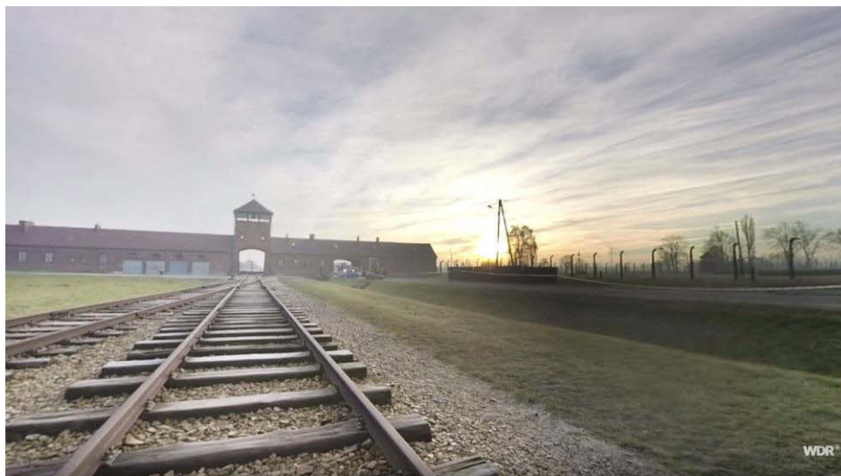
Außenansicht von Birkenau