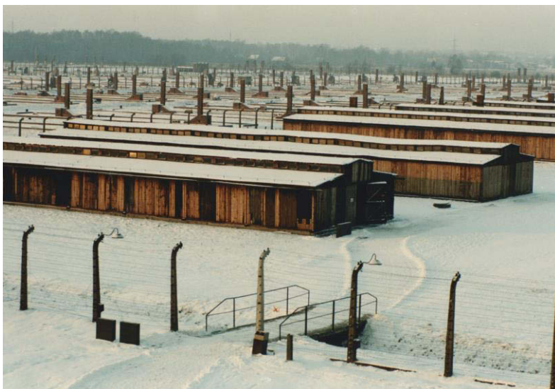
Das sogenannte Quarantäne-Lager in Birkenau