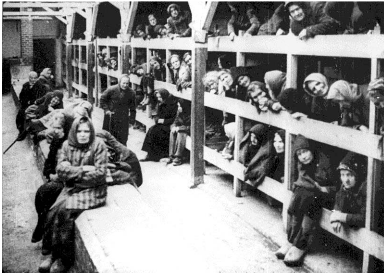
Holzbaracke in Birkenau nach der Befreiung durch die Alliierten