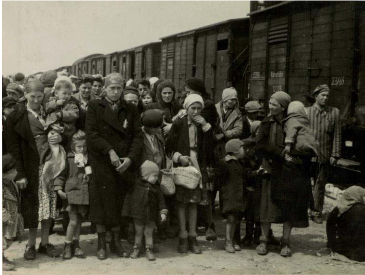
SS-Foto (1944): Deportationszüge in Birkenau