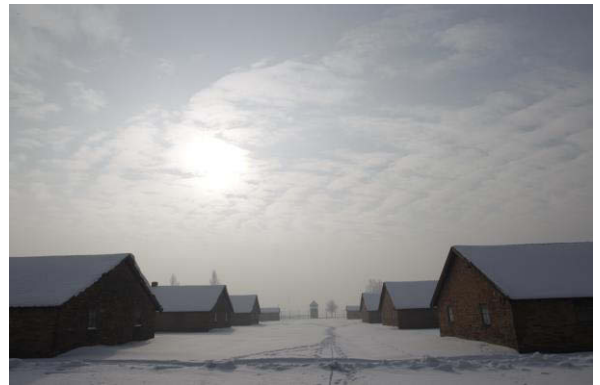
Das ehemalige Frauenlager in Birkenau