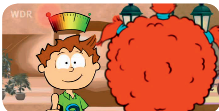
Knietzsche erklärt die Wahrheit

Johannas Freundin möchte am Nachmittag mit ihr spielen. Sie hat aber keine Lust und sagt deshalb, dass sie zum Arzt muss.