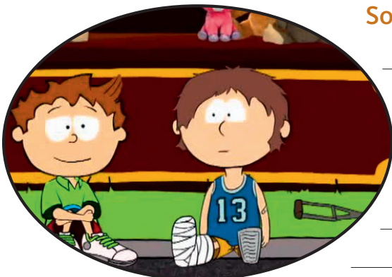
Jemand hat sich das Bein gebrochen