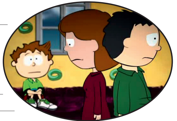
Die Eltern lassen sich scheiden