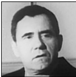
Andrei Gromyko (Sowjetischer Außenminister)