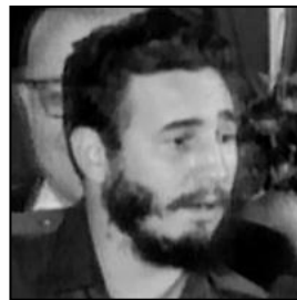
Fidel Castro (Kubanischer Präsident)