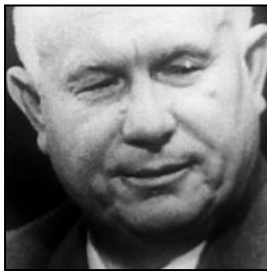
Nikita Chruschtschow (Sowjetischer Präsident)