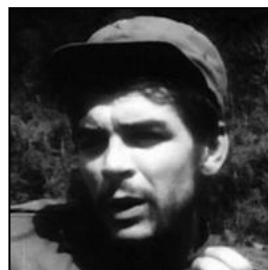
Che Guevara (Kubanischer Revolutionär)