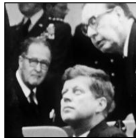
Krisenstab (US Politiker, Experten und Sicherheitsberater)