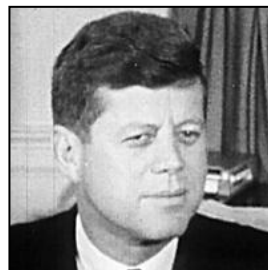
John F. Kennedy (US-Präsident)