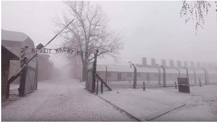
Tor Stammlager Auschwitz I