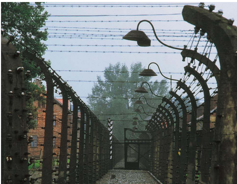
Stacheldrahtzaun Auschwitz I