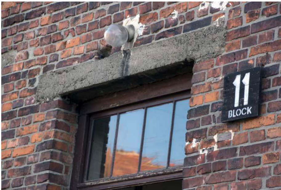
Der Block Nr. 11 in Auschwitz I: der ehemalige Lagerarrest