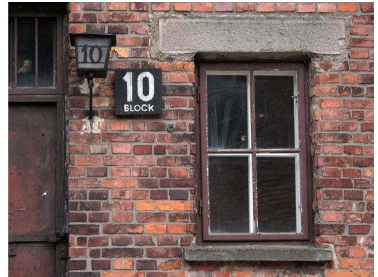
Block Nr. 10 in Auschwitz I, wo medizinische Experimente durchgeführt wurden