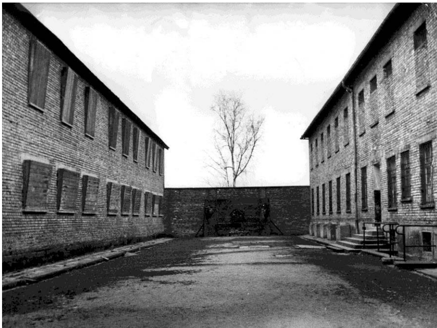
„Todeswand“ Auschwitz I