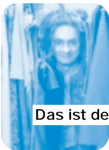
Das ist der Gendarm