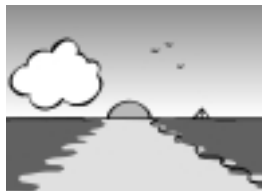
das M _ _ r