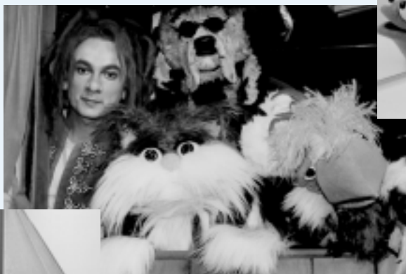
Das ist ein _ _ _ _ _