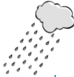
der R e _ _ n