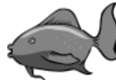
der F _ _ ch