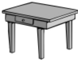
der _ _ sch