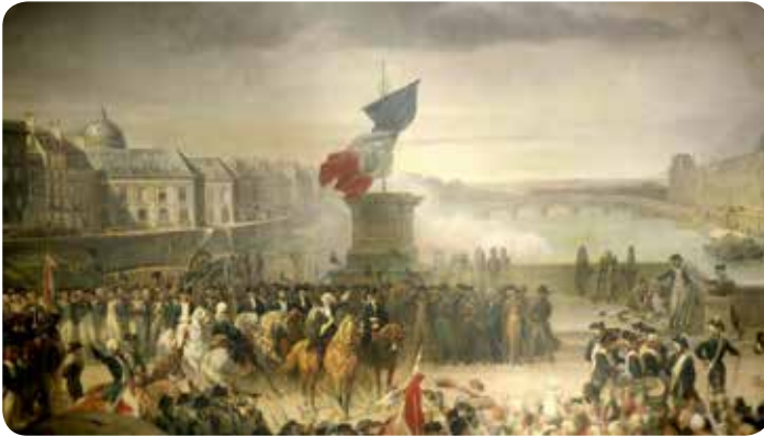
Menschenmenge und Trikolore in Paris

Die vier Bilder werden nacheinander gezeigt, um ein wiederholendes Klassengespräch zum Inhalt der vergangenen Geschichtsstunde zu führen.