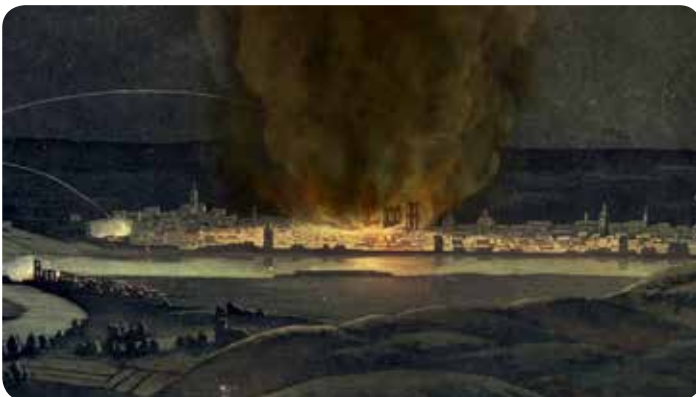
Mainz in Flammen, Beschuss durch preußische Truppen