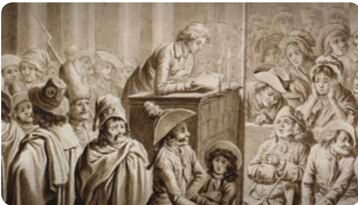
Mainzer Freiheitsfreunde bei einer Tagung