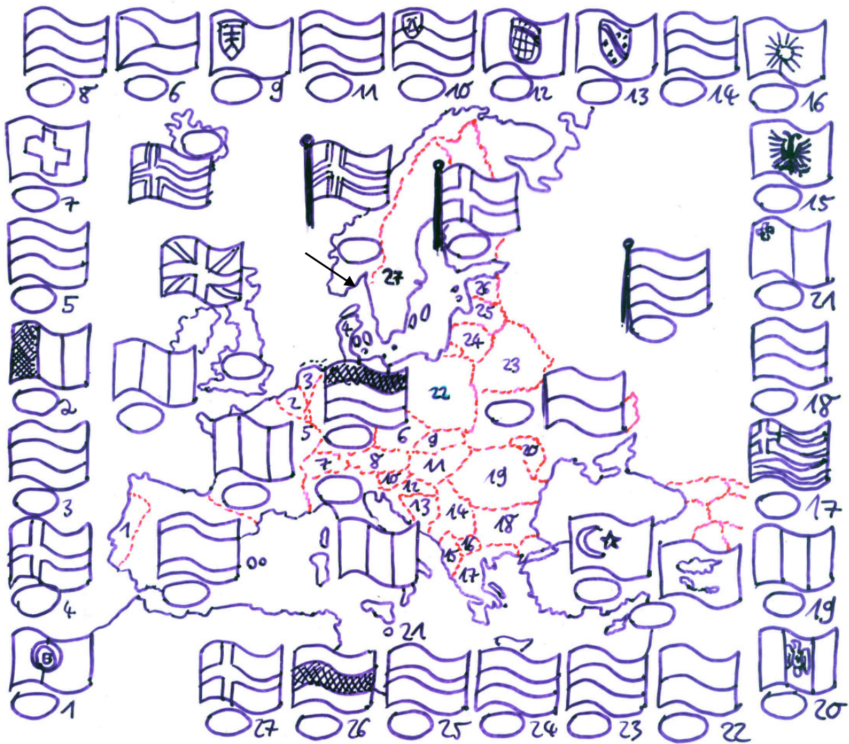
Abbildung (Fragen: siehe erste Seite!)